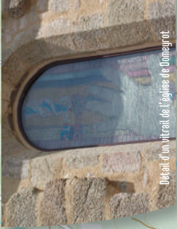
Détail d'un vitrail de l'église de Domeyrot