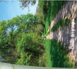
Chemin des granges